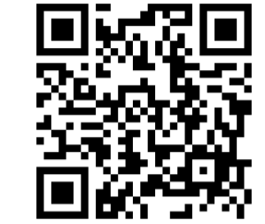
予約フォーム QR コード